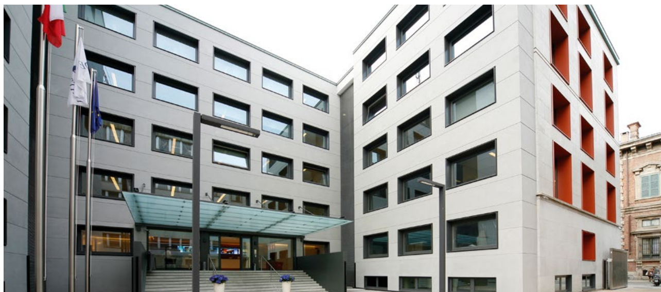
Sede Gruppo DeA Capital.

Il web è da sempre il principale strumento di contatto per gli investitori, i quali hanno la possibilità di iscriversi a varie mailing list al fine di ricevere tempestivamente tutte le novità relative al Gruppo DeA Capital e di inviare domande o richieste di informazioni e documenti alla Funzione Investor Relations della Società, che si impegna a rispondere in tempi brevi, come indicato nella Investor Relations Policy pubblicata sul sito.